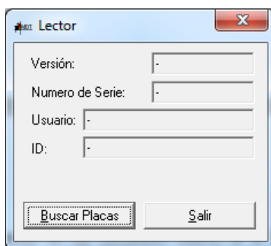
No se muestra información

Al ejecutar el programa, aparece una ventana con la información que se ha leído de la USB.